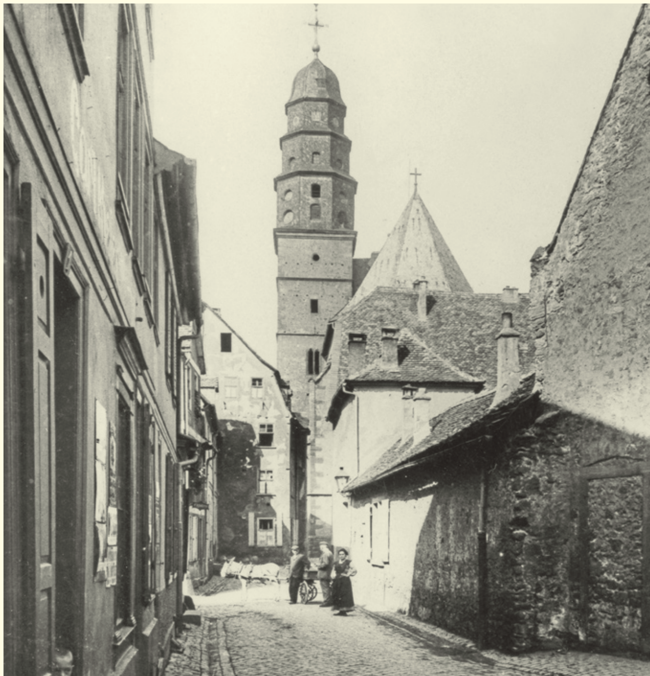
Marienkirche, um 1910